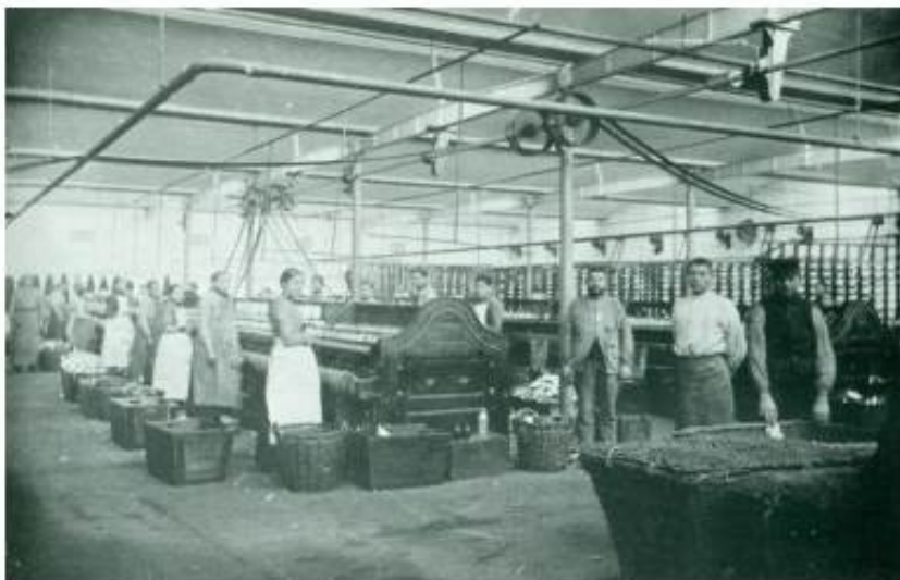
Vrouwen en mannen aan het werk in de Twentse textiel.

te vallen bij ziekte of andere onvoorziene omstandigheden. In andere Twentse fabrieken werken de gehuwde vrouwen vooral in de poets- en katoenafvalbedrijven. Het is smerig, minderwaardig en laagbetaald werk, waar de meeste mannen zich niet aan wagen.