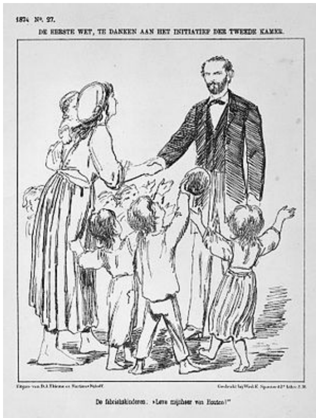
Prent uit 1874. De fabriekskinderen: "Leve meneer Van Houten".

goed. Deze laatste twee afdelingen zijn de kleinste, met ongeveer 25 arbeiders per afdeling, allemaal mannen. Bij de spinnerij werken 71 arbeiders, waarvan 30% vrouw. Het werken in de spinnerij is zwaar door de hitte en de hoge vochtigheid, die moet voorkomen dat de draad knapt. Ook moet er in de spinnerij gesjouwd worden met bakken en klossen.