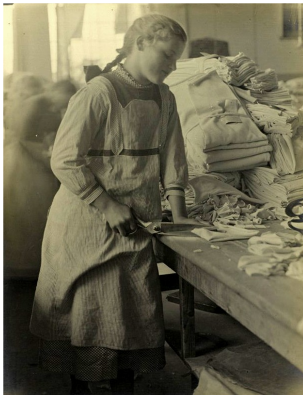
Meisje aan het werk bij Jansen & Tilanus in Vriezenveen.

De gehuwde vrouwen die werken doen dat (volgens een onderzoek uit 1909) vooral als hun man niet of