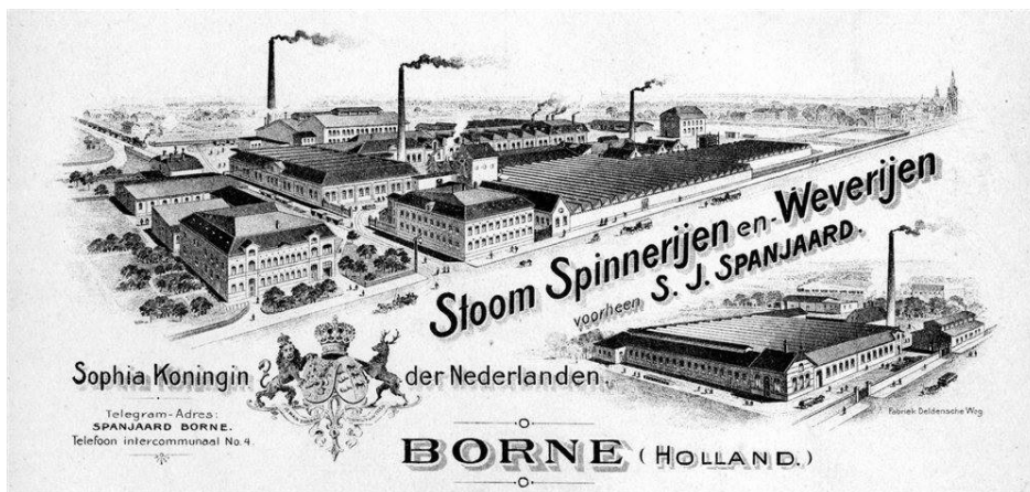
Negentiende eeuwse briefhoofd van de 'Stoom Spinnerijen en Weverijen voorheen S.J. Spanjaard'.

Voor de industrialisatie weven de Twentse boeren thuis, vooral in de wintermaanden als het werk op het land stil ligt. Weven is mannenwerk, want het weven op het handweefgetouw is zwaar. De vrouwen spinnen, dat vereist vingervlugheid. Kinderen doen het relatief lichte werk van spoelen: het afwinden van de strengen op klossen, zodat het garen geweven kan worden. Handelaars kopen dit goed op. Later worden deze handelaars fabriqueurs: ze geven de boeren opdrachten en instructies en leveren het garen. Ze maken afspraken over kwaliteit, weefpatronen en levertijden. De fabriqueur neemt zelf ook een deel van het productieproces in handen: bleken, kalanderen (het glad en glanzend persen van de stof), mangelen en soms het verven gebeurt in of bij zijn woonhuis.