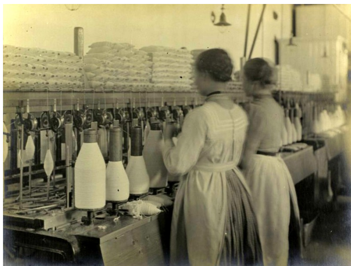
Vrouwen aan het werk in de tricotweverij van Jansen & Tilanus in Vriezenveen.

De lijst met arbeiders van 1874 is opgedeeld naar de verschillende afdelingen: de spinnerij, de spoelerij (opklossen van garen), de weverij, de damastweverij en de afdeling voor het kalanderen, ruwen en verven van het